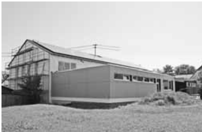
Die städtische TSV-Halle mit dem neuen Anbau

Sachgebietsleiter Manuel Köhle informierte, dass aufgrund der baldigen Fertigstellung und Inbetriebnahme der städtischen TSV-Halle die regelmäßigen Reinigungsarbeiten durch zu führen sind. Aus betriebswirtschaftlicher Sicht wurde geprüft, ob eine erneute Vergabe, wie vor der Baumaßnahme oder die Durchführung der Arbeiten durch eigenes Personal günstiger ist.