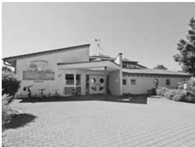
Blick auf den städtischen Kindergarten Pustelblume in der Grabenstraße

Der Gemeinderat stimmte der Kindergartenbedarfsplanung für das Kindergartenjahr 2011/2012 zu.