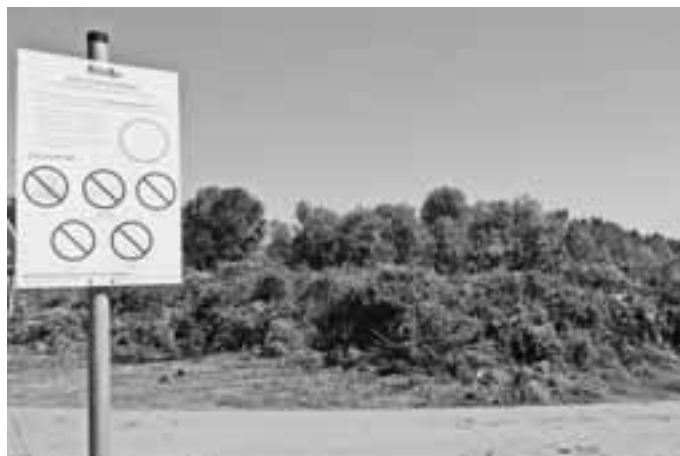
Lagerplatz der städtischen Grüngutdeponie "Kellerle"