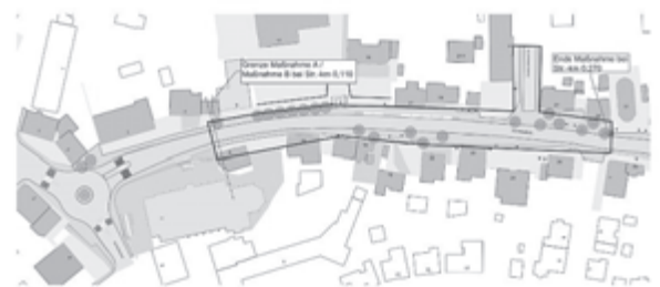
Abbildung 2 Auszug Gestaltungsplan, Maßnahme B

Für die Gehwegbereiche außerhalb des Kreisverkehrs wurde im Frühjahr 2025 ein Förderantrag beim Land nach dem LGVFG gestellt. Erwartete Förderung: 50–75 %. Voraussetzung sind durchgängige Gehwege mit einer Mindestbreite von 2,50 m auf beiden Straßenseiten. Das Ingenieurbüro Germey machte deutlich, dass in diesem Zuge auch die Querneigung des Gehweges verringert und die Verkehrssicherheit verbessert wird. Außerdem erhält die Stadt Fördermittel aus der städtebaulichen Erneuerungsmaßnahme „Stadtkern II“ im Programm „Lebendige Zentren“ (LZP).