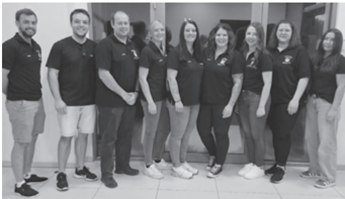
Die neue Vorstandschaft